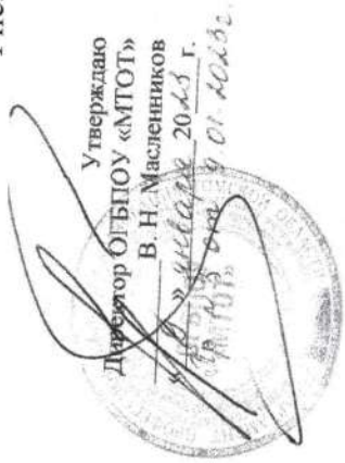
Структура и органы управления ОГБПОУ «МТОУ»