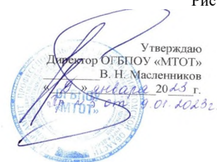
Структура и органы управления ОГБПОУ «МТОГ»